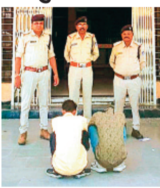
क्या था पूरा मामला

अपनी 16 वर्षीय नाबालिग पुत्री का जबरन विवाह कराने के मामले में लीमाचौहान थाना पुलिस ने संबंधित किशोरी के कथनों व दस्तावेजों के आधार पर उसकी मां, पिता और जिससे शादी करवाई गई उस युवक पर मामला दर्ज किया है। उल्लेखनीय है कि बाल-विवाह मामलों पर इस बार प्रशासन बेहद सख्त नजर आ रहा है। अब तक पांच मामलों में दोषियों पर बाल-विवाह प्रतिषेध अधिनियम के तहत मुकदमे दर्ज किए जा चुके हैं।